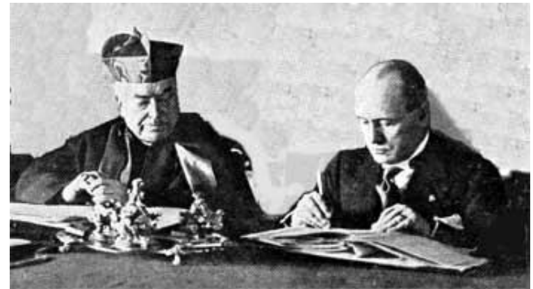
B. Mussolini e il Cardinale Gasparri firmano i Patti Lateranensi (11-02-1929)